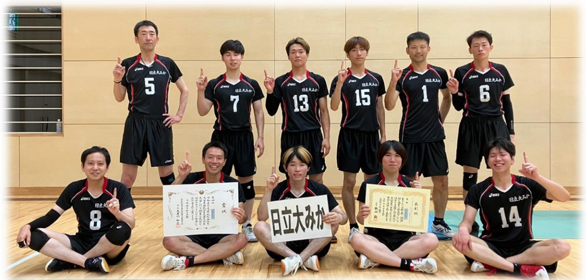
[令和5年度優勝チーム：日立大みか]