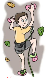
スポーツ クライミング