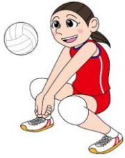
ママさん バレーボール